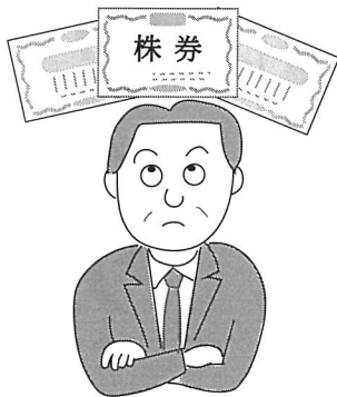
図1 個人・発行法人以外の法人に対する 非上場株式の譲渡

例えば、時価が3000万円の自社株を5000万円で売却した場合、売却額と時価との差額の2000万円は、買主から売主への贈与となります（次頁表参照）。