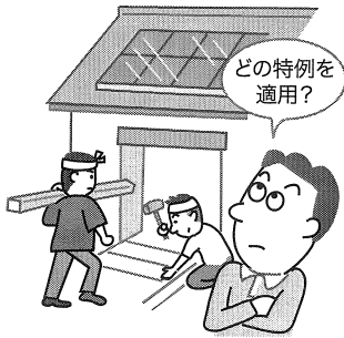
図表1 税額控除の種類

個人が、住宅の新築や購入又は増改築等を行った場合、一定の要件を満たす時には、五種類ある税額控除のいずれかを適用することによって、居住の用に供した年分以後の各年分の所得税額から一定金額を控除することができます。 ただし、どの税額控除を適用するか判断が難しいところがありますので、今回、ポイントを整理してみます。