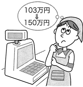
(図表1) 配偶者控除額

主な項目の適用時期は、次頁表のとおりです。 なお、前年以前の改正で適用時期が今年以降となる項目も記載しています。