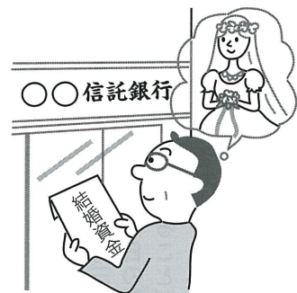
図表4 一括贈与の対象

4 確定拠出年金 従業員が加入する個人型確定拠出年金に小規模企業事業主が拠出した掛金の損金算入が認められます。また、個人型確定拠出年金に、企業年金加入者、公務員等共済加入者、専業主婦等の加入が追加され、税制上の優遇措置も適用されます。 5 ふるさと納税 ふるさと納税が拡充され、特例控除額の上限が個人住民税所得割額の二割(現行一割)に引き上げられるとともに、一定のサラリーマンは確定申告が不要となります。 ための資金を信託等した場合に、一人一、〇〇〇万円(結婚費用は三〇〇万円)まで贈与税が掛かりません(図表4参照)。